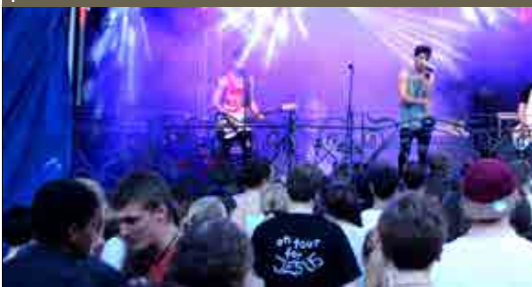
48 Rock am Stein