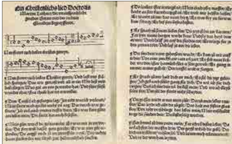
„Nun freut euch lieben christen gmeyn“, erschienen im „Achtliederbuch“ aus dem Jahr 1524.