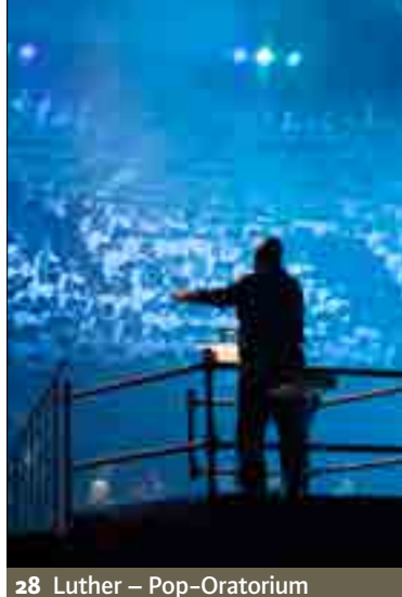
28 Luther – Pop–Oratorium