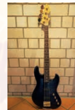
Blade Tetra B-2

Ein traumhafter Bass mit ultraflacher Saitenlage, dem Tiefmitten-Growl den Jazzbass-Fans so lieben und einer flexiblen Klangregelung die ein breites Spektrum an modernen Sounds ermöglicht. Vorfürmodell, dunkelblau transparent. Der Bass ist noch aus der legendären Blade Japan Serie und wird als Einzelstück weit unter Wert verkauft.