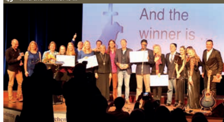
43 And the winner is ...

+ Verband für christliche Populärmusik in Bayern e.V.