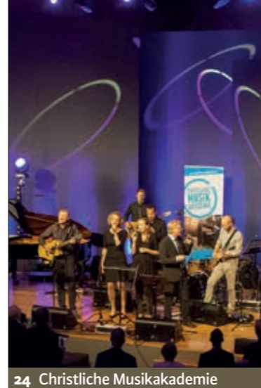
24 Christliche Musikakademie