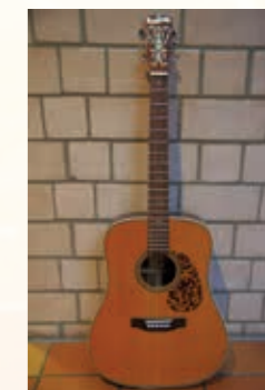
Blueridge BR 160

Vintage Style Dreadnoughts, Boden und Zargen Palisander massiv, Decke Sitkafichte. Mittiger charakterstarker Klang der an die beliebten Gitarren mit „M“ erinnern. Einzelstück, II Wahl (unbedeutender Lackfehler an der unteren Zarge). Unser Angebot liegt gut 40% unter dem aktuellen Preisen im Internet.