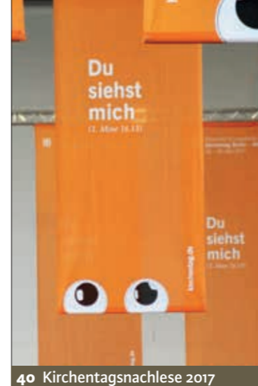
40 Kirchentagsnachlese 2017