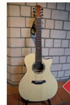
Blade PDE-1 VW „Tele“